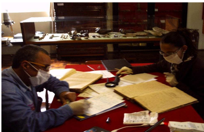
Foto 1 – Bolsistas realizando catalogação da documentação.

A catalogação foi feita de forma a transcrever a linguagem do português do século XIX para o atual, com o auxílio do professor de Letras especialista em português arcaico. Posteriormente, essa transcrição foi digitada em um formato pré-definido pelas bibliotecárias estando prontas para sua indexação no sistema de dados. O sistema de dados referido está sendo viabilizado pela parceria com o profissional da área da tecnologia da informação com as bibliotecárias, as quais estão verificando diversas opções de programas, para que escolham o que melhor se adapte aos objetivos do projeto.